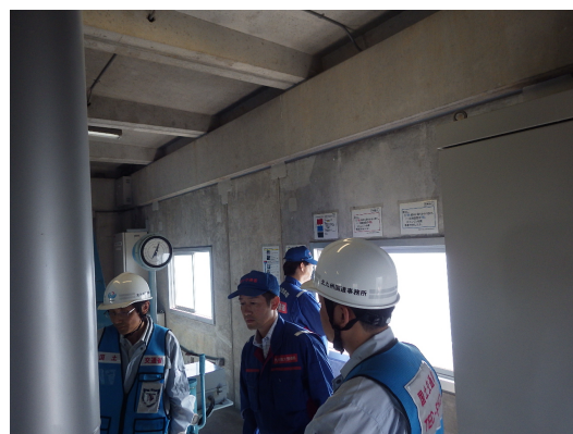
ゲート操作室における訓練の状況