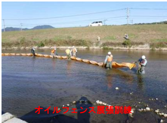
オイルフェンス展張訓練