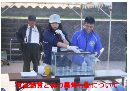
有害物質と魚の異常行動について