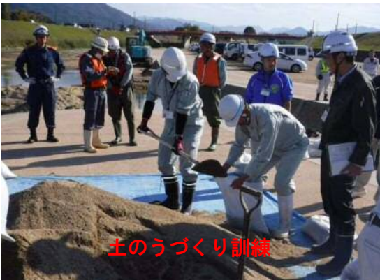
土のうづくり訓練