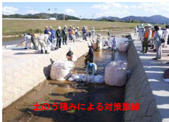
土のう積みによる対策訓練