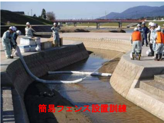
簡易フェンス設置訓練