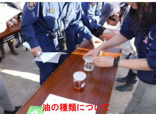
油の種類について