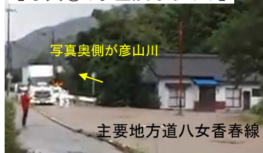
【写真①(家屋浸水状況)】