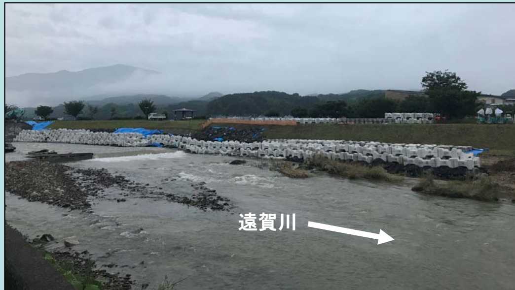
復旧完了(7月12日6時00分撮影)