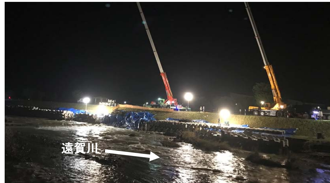
復旧状況(7月11日撮影)