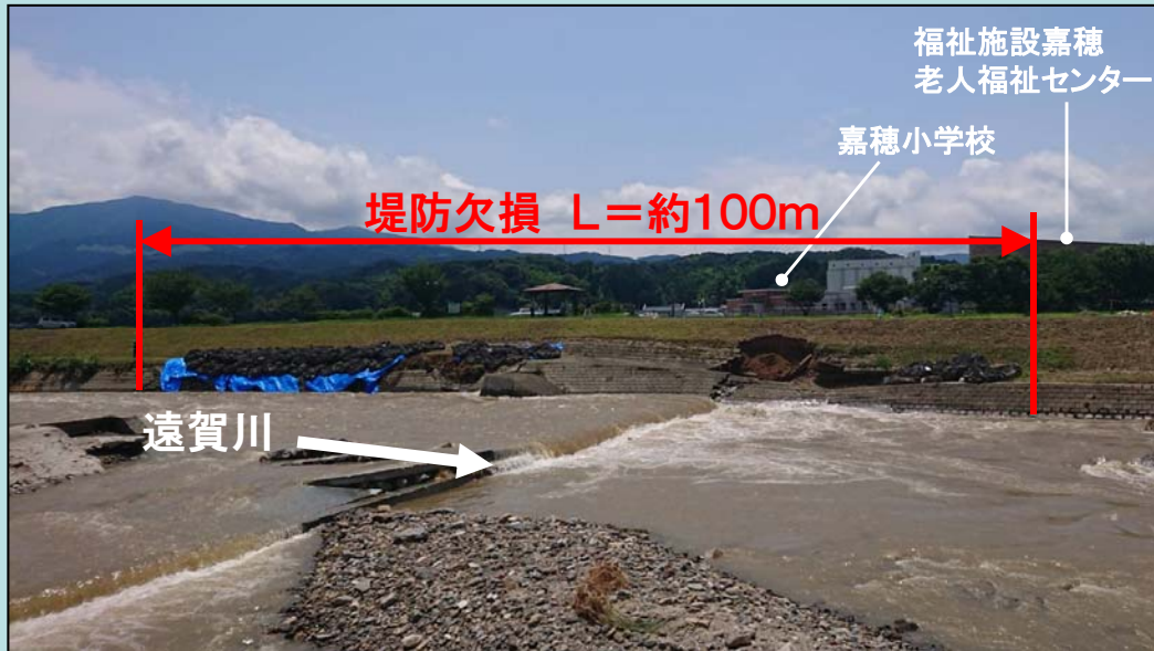
被災状況(7月8日撮影)