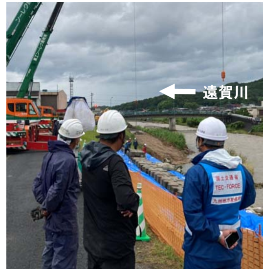
復旧状況(7月10日撮影)