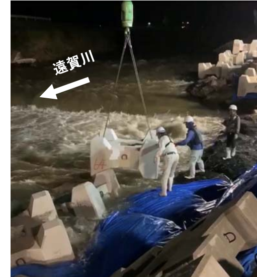
復旧状況(7月11日撮影)