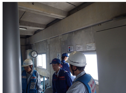
ゲート操作室における訓練の状況