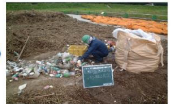
(4) 手作業で分別し処分