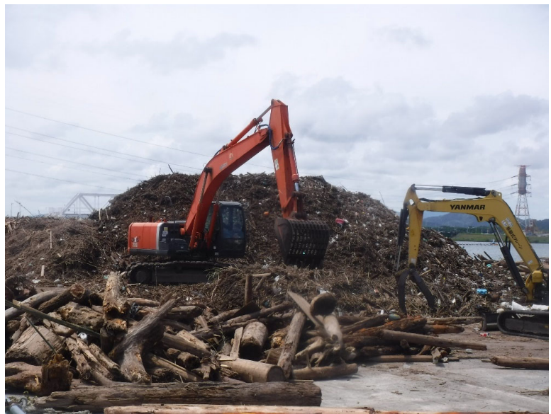
漂着ゴミ(かき上げ後7月20日撮影)

ゴミの多くは草木類です。その他ペットボトル、発泡スチロール等の生活ゴミですが、様々な種類のゴミが混在しています。