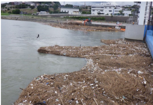
水面からかき上げ作業(7月14日撮影)

なお、今回の大雨だけで3,130m 3 、小学校25mプールにして12.5杯分のゴミを回収しています。