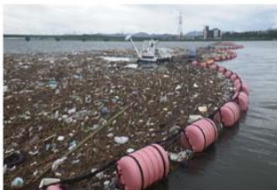
(1) 作業船とフェンスにて回収

作業船によりフェンスで囲ったゴミを岸の方へ引き寄せて、バックホウで陸揚げして乾燥させた後に、可燃物・不燃物等の9種類に分別して処分を行います。