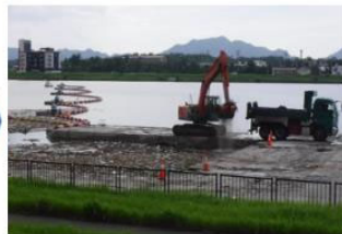
(2) バックホウにて陸揚げ