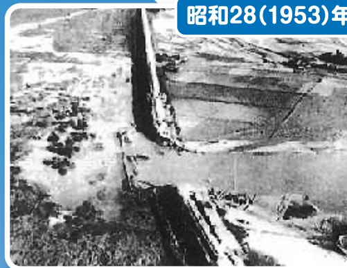
破堤氾濫による浸水状況(直方市)