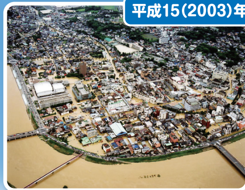
市街地の浸水状況(飯塚市)