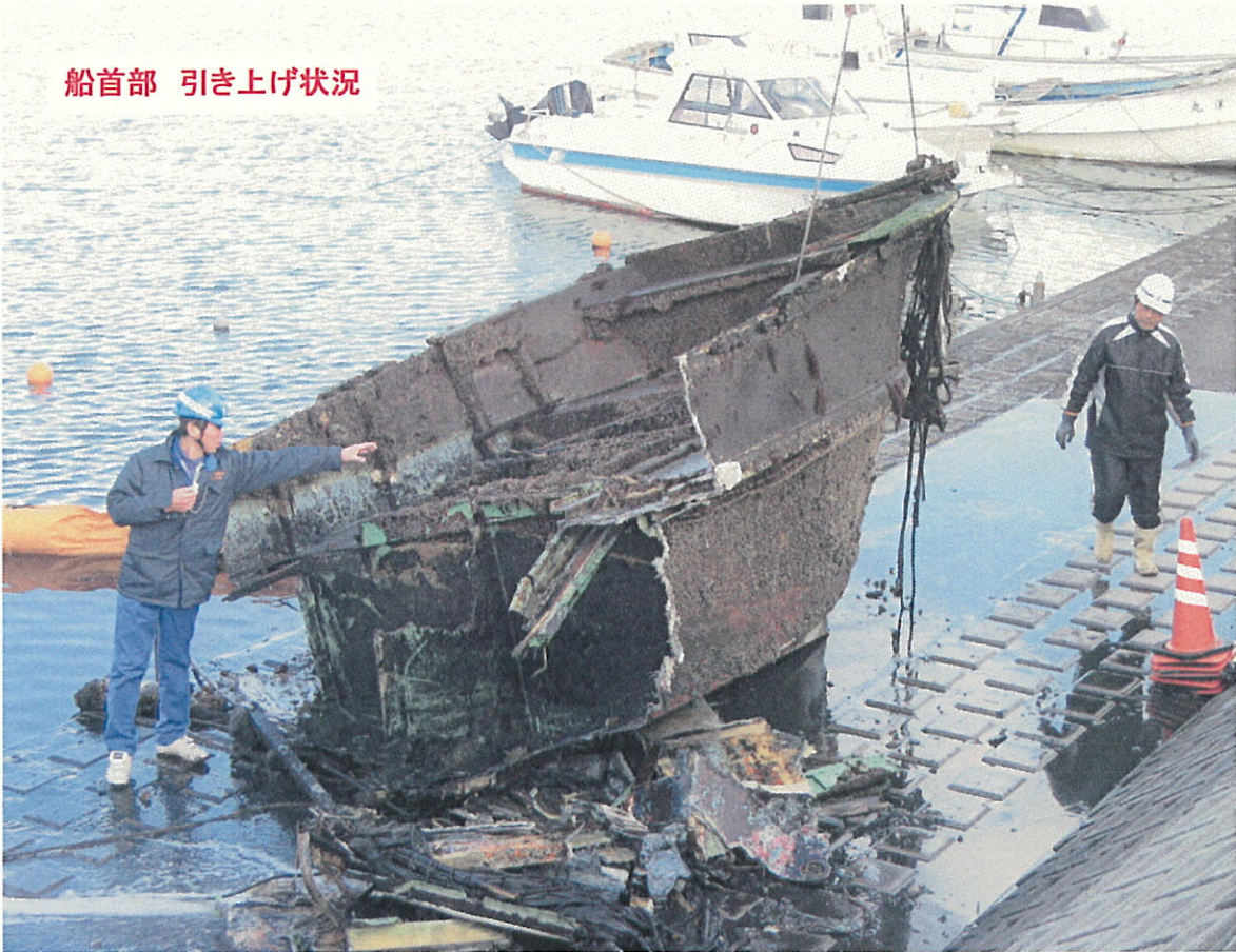
船首部 引き上げ状況