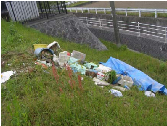
投棄状況（大任町大字今任字水町）