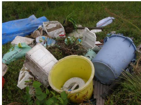
投棄物（バケツ、発泡スチロール容器等）