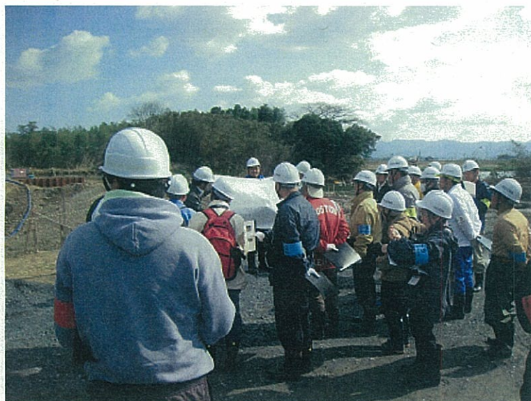
橋梁下部工工事の確認