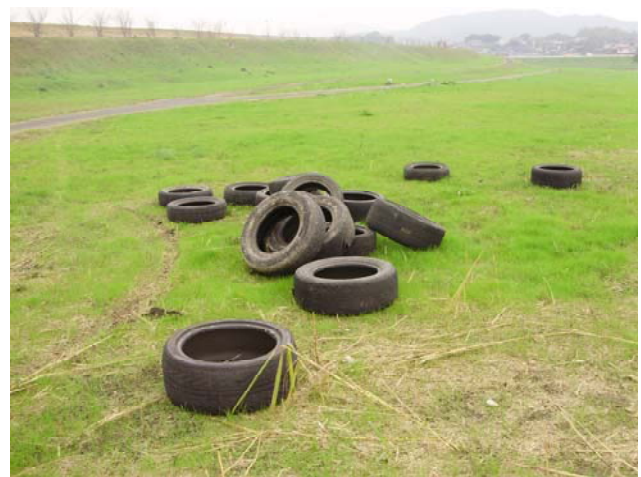
使用済みタイヤ16本（軽トラ1台分）