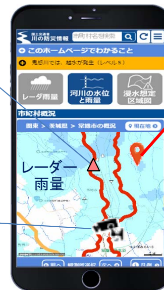
スマートフォン版