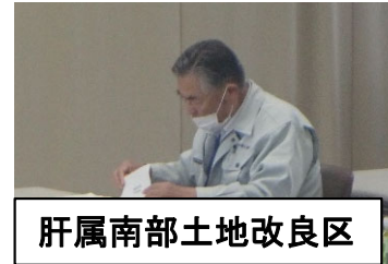
肝属南部土地改良区