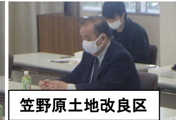
笠野原土地改良区