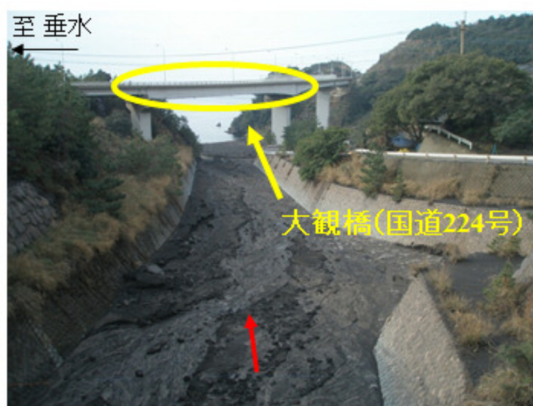
写真① 第一有村橋から下流を望む（H27. 2. 23 9時30分撮影）