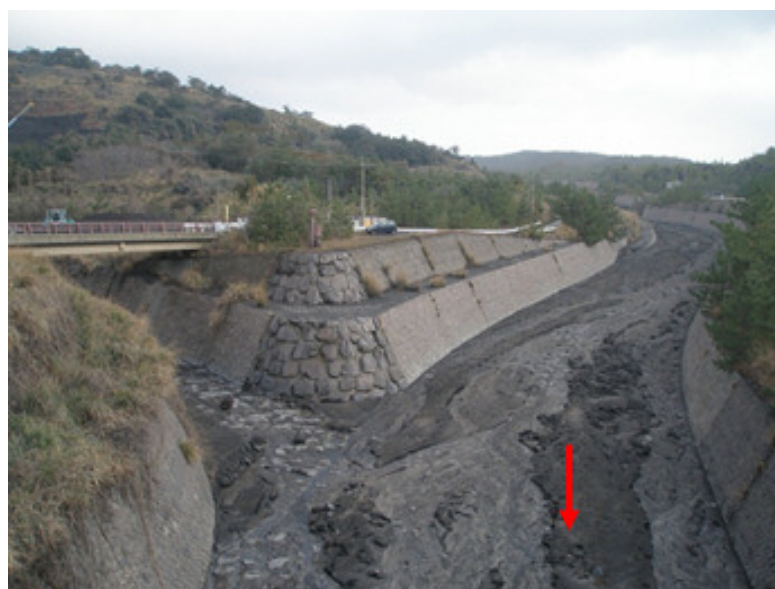
写真② 第一有村橋から上流を望む（H27. 2. 23 9時30分撮影）