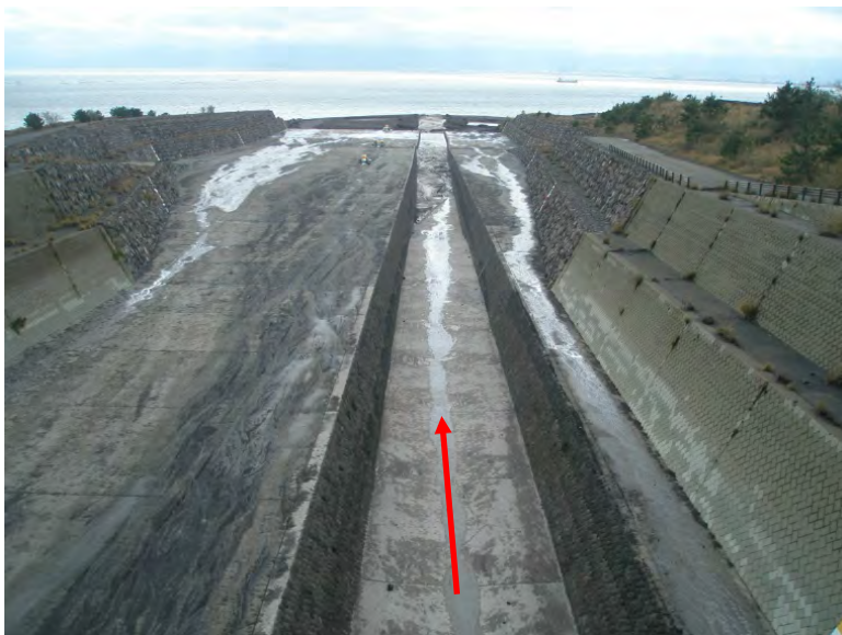
写真① 野尻橋から下流を望む (H26. 3. 13 13時30分撮影)