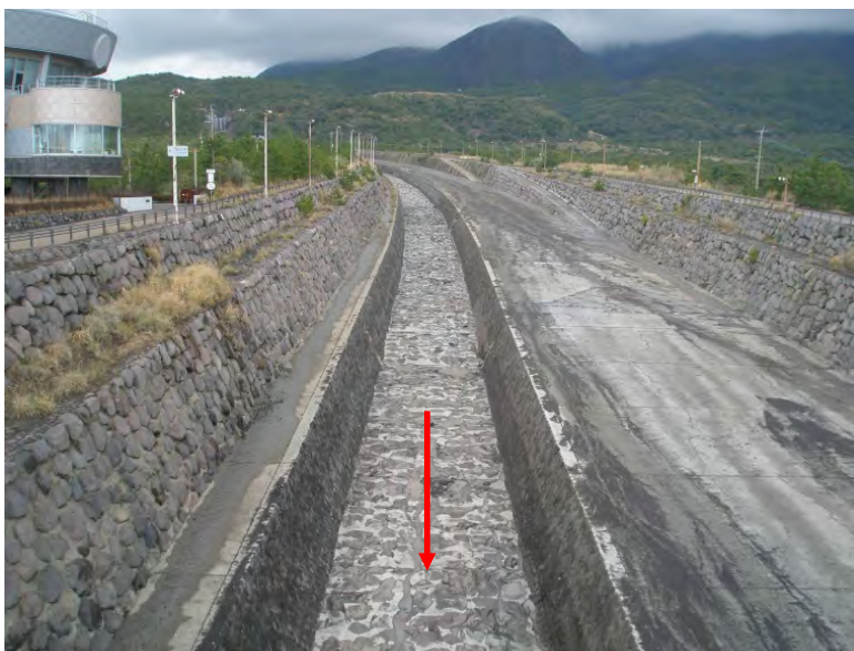
写真② 野尻橋から上流を望む (H26. 3. 13 13時30分撮影)