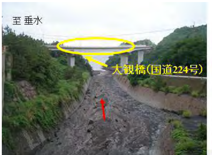
写真③ 第一有村川橋から下流を望む（H26. 5. 15 9時50分撮影）