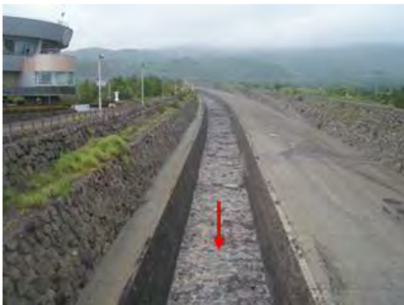
※顕著な土砂堆積は見られない。