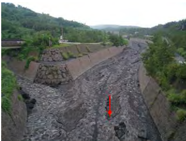
写真④ 第一有村川橋から上流を望む（H26. 5. 15 9時50分撮影）