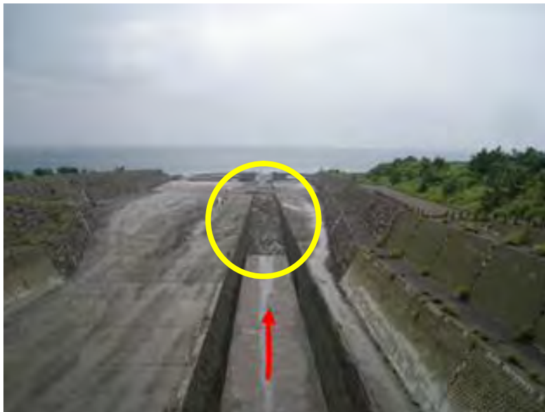
※河口付近に部分的な土砂堆積が見られる。