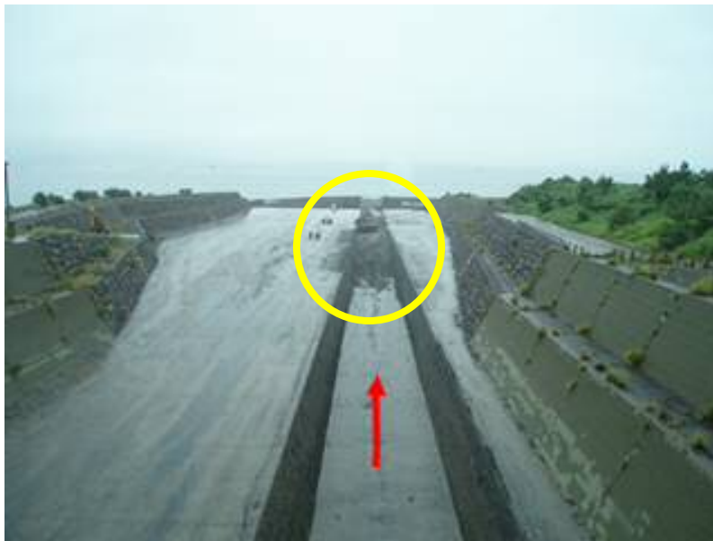
※河口付近に部分的な土砂堆積が見られる。