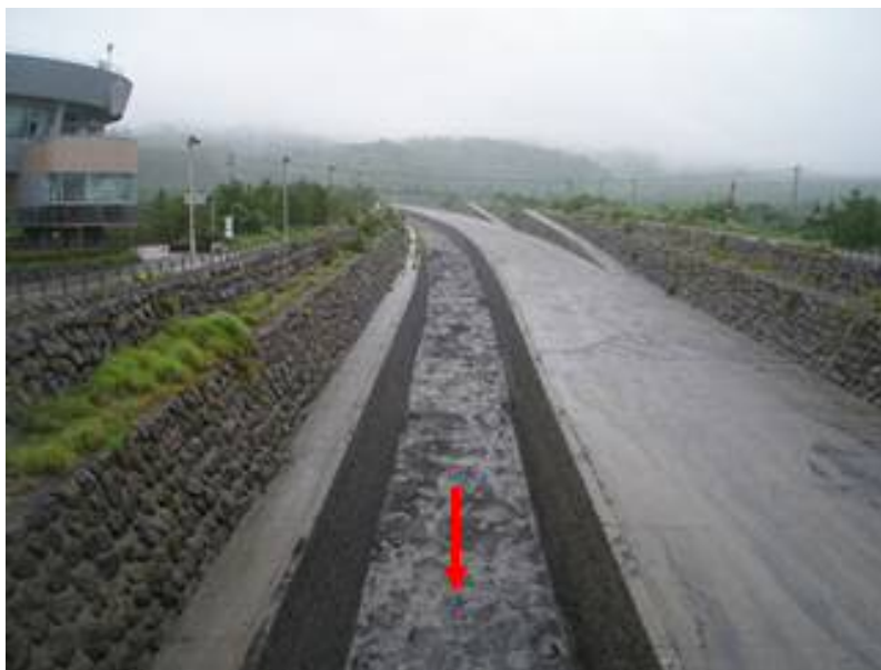
※顕著な土砂堆積は見られない。