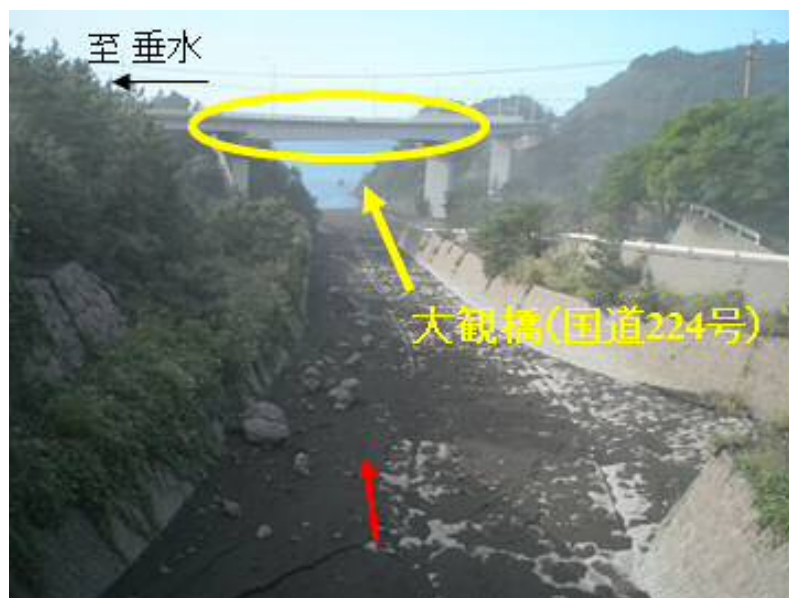
写真③ 第一有村橋から下流を望む（H26. 10. 14 9時30分撮影）