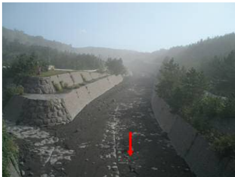
写真④ 第一有村橋から上流を望む（H26. 10. 14 9時30分撮影）