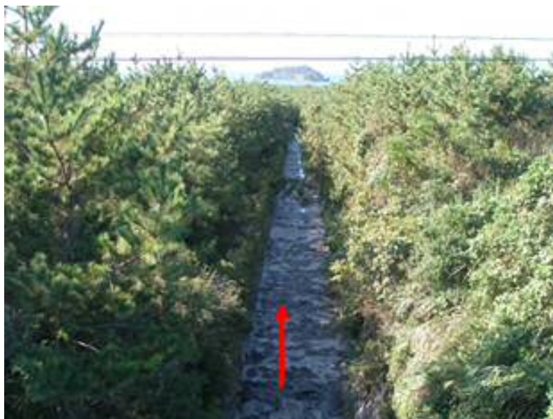
写真① 持木橋から下流を望む（H26. 10. 14 9時00分撮影）