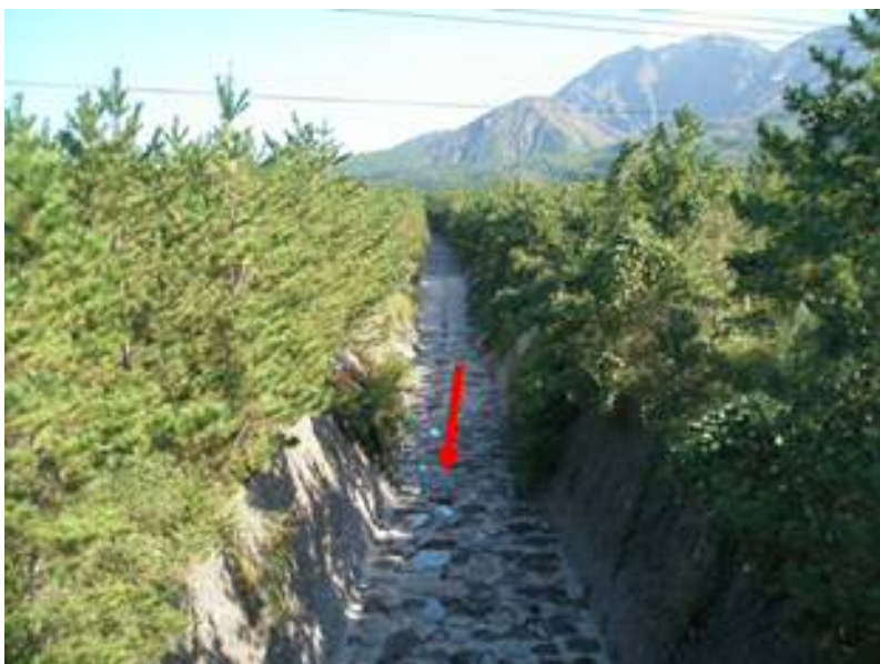
写真② 持木橋から上流を望む（H26. 10. 14 9時00分撮影）