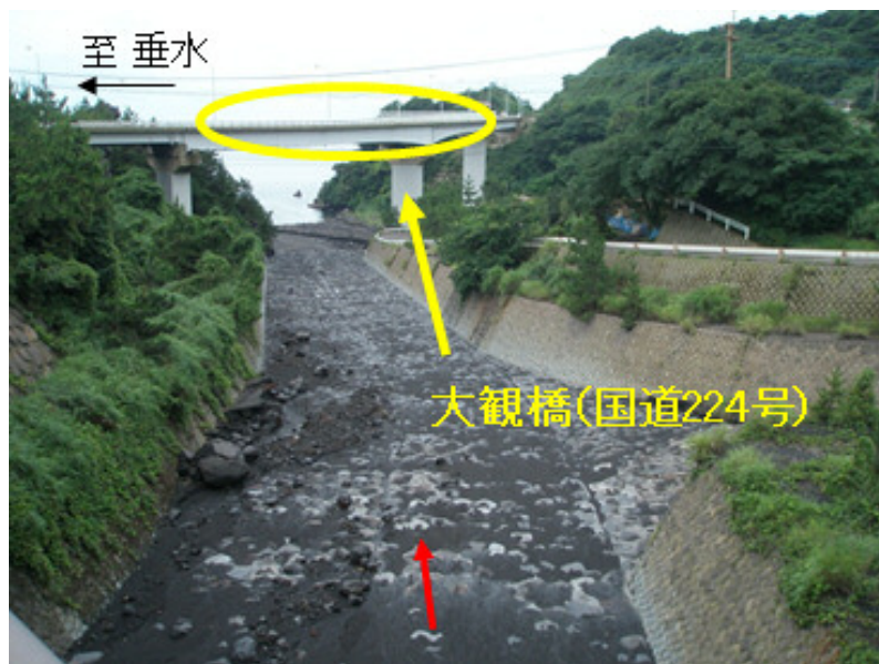
写真① 第一有村橋から下流を望む（H27.7.7 11時00分撮影）