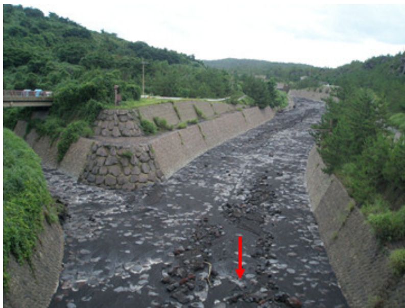
写真② 第一有村橋から上流を望む（H27.7.7 11時00分撮影）