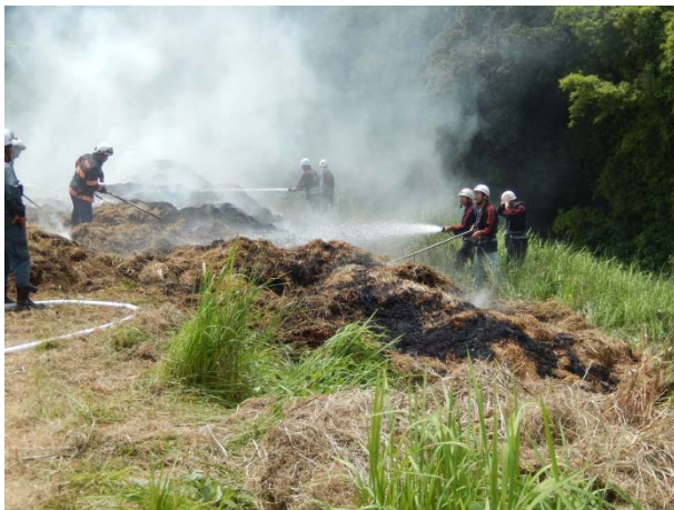
堤防上の消火活動状況