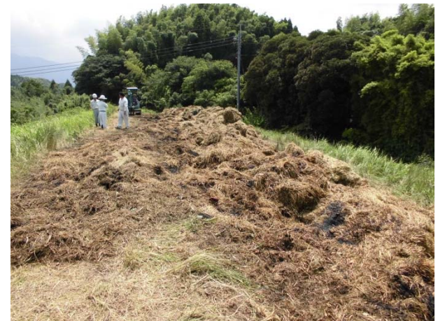
消火完了後の状況