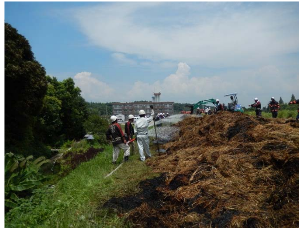
民家側の消火活動状況