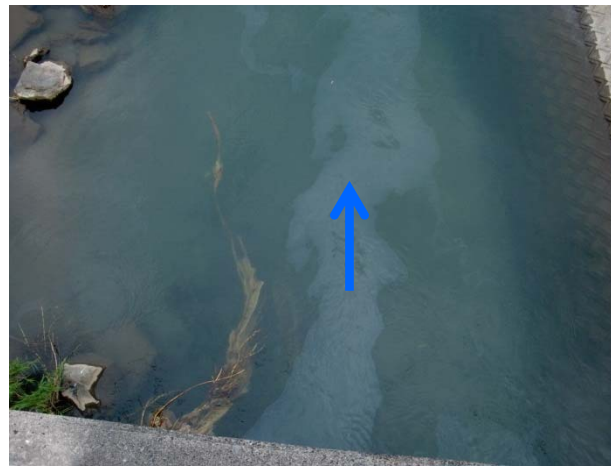
河川への流出状況