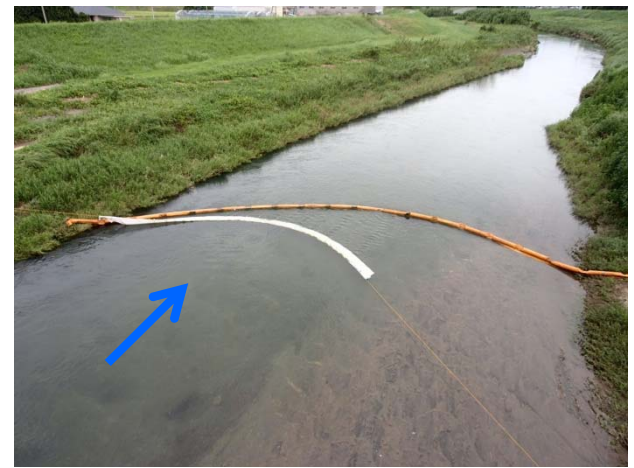
下流での対策状況 (オイルフェンス)