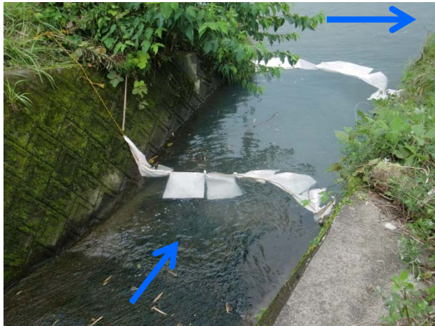
発生場所・対策状況 (赤之迫排水樋管)