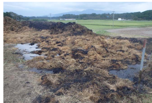
消火完了後の状況