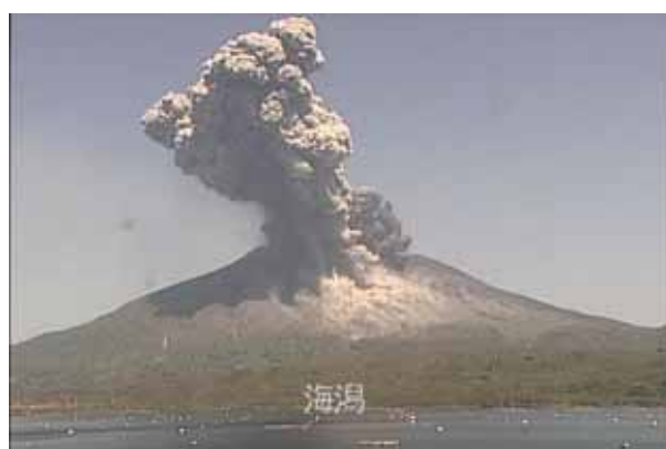
桜島監視カメラ映像