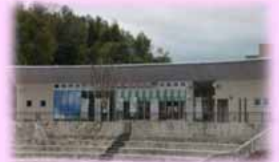
「きもつき川水辺館」はリナシティかのやのすぐそばです。

王子町ホタル愛好会(和田井堰ホタルの里)HPアドレス → http://princehomes010.web.fc2.com/firefly/top.htm