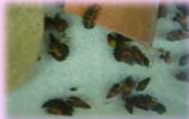
ホタルの幼虫はどれでしょう？

現在、「きもつき川水辺館」には、ホタルの幼虫がいます。 この幼虫は、鹿屋市にある和田井堰公園内で見られるホタルの保護・増殖活動をされている王子町ホタル愛好会の方にご指導いただき、職員自らホタルの交配からふ化させたものです。 ぜひご覧ください！！