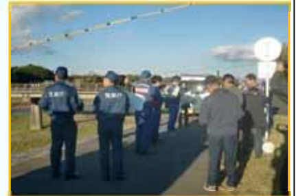
セミナー(現地確認)の状況