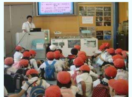
H27.10.23 鹿屋市立西俣小学校

現在、「きもつき川水辺館」には、ホタルの幼虫がいます。 この幼虫は、鹿屋市にある和田井堰公園内で見られるホタルの保護・増殖活動をされている王子町ホタル愛好会の方にご指導いただき、職員自らホタルの交配からふ化させたものです。 ぜひご覧ください！！