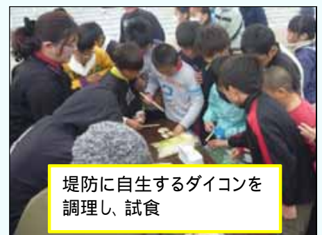
堤防に自生するダイコンを調理し、試食