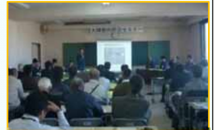
セミナー(会議)の状況