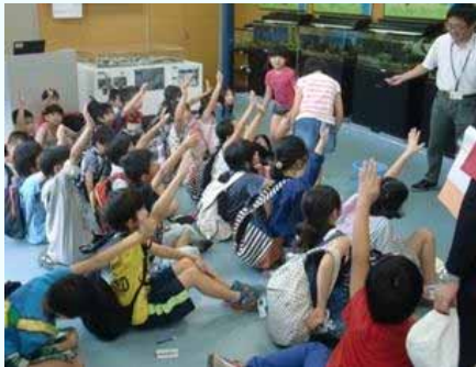
H27.5.20 鹿屋市立西原小学校

河川情報施設「きもつき川水辺館」を訪れた小学生を対象に出前講座を行い、肝属川がどんな川なのか、あらましを学んでいただきました。講師の話に興味津々に聞き入り、肝属川についての知識を増やしてもらえたことかと思えます。