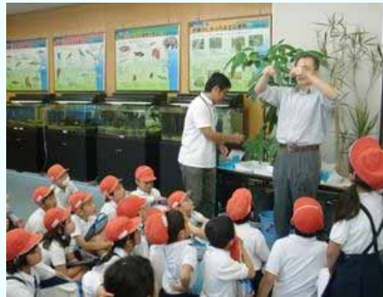
H27.5.21 鹿屋市立笠之原小学校