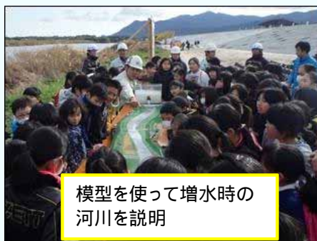
模型を使って増水時の河川を説明