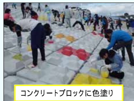
コンクリートブロックに色塗り