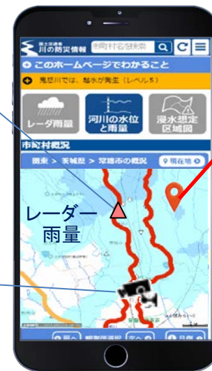
スマートフォン版