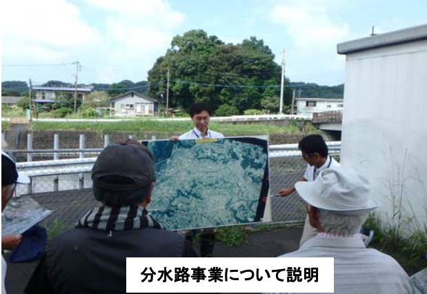
分水路事業について説明

平成28年9月15日(木)、 高齢者ふあいサロン「どんぐり」 (鹿屋市打馬)の11名が鹿屋分水路を見学されました。