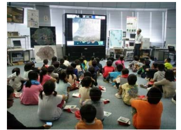
▲垂水市立水之上小学校