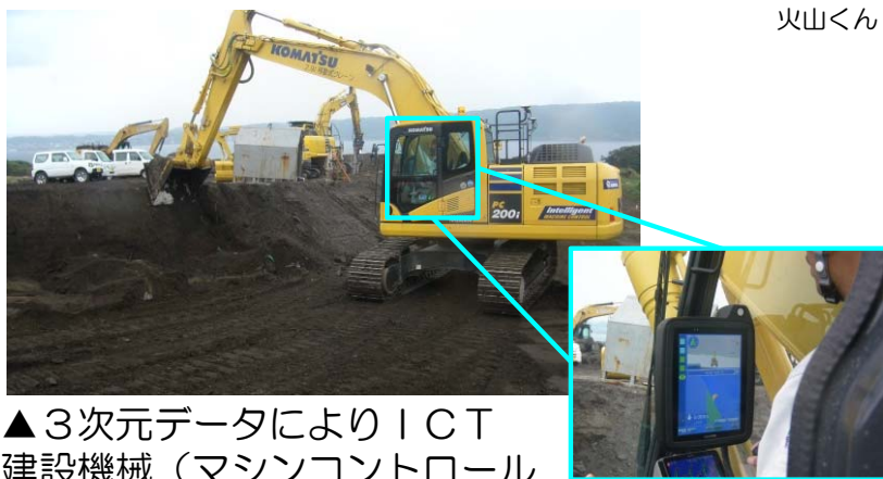
▲3次元データによりICT建設機械（マシンコントロールバックホウ）を自動制御し切土等の施工実施