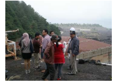
▲インドネシア政府大学研究者