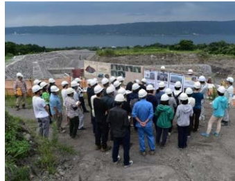
▲鹿児島大学砂防学実習