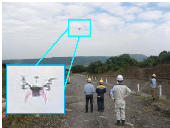
▲ドローンによる3次元測量

国土交通省では今年度より、土工工事（切土、盛土）において測量から設計、施工、検査まで全てのプロセスをICT（情報通信技術）を活用した工事を実施します。