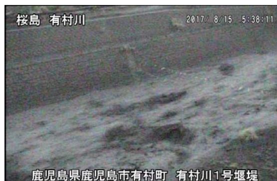
有村川1号堰堤 5:38 頃