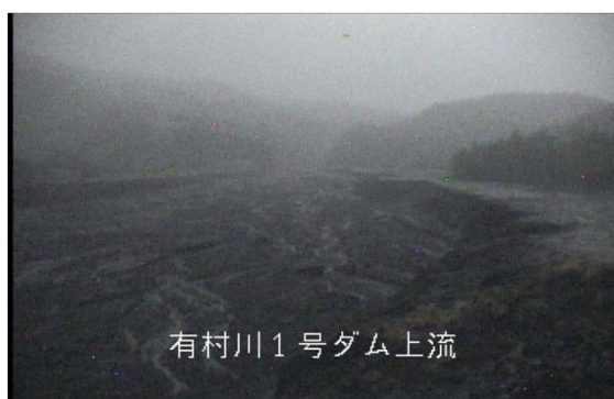
有村川1号ダム上流 5:38 頃