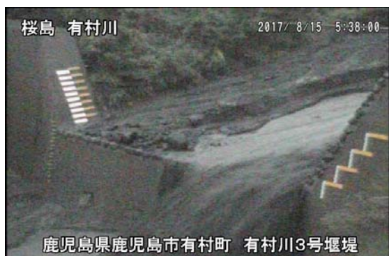
有村川3号堰堤 5:38 頃