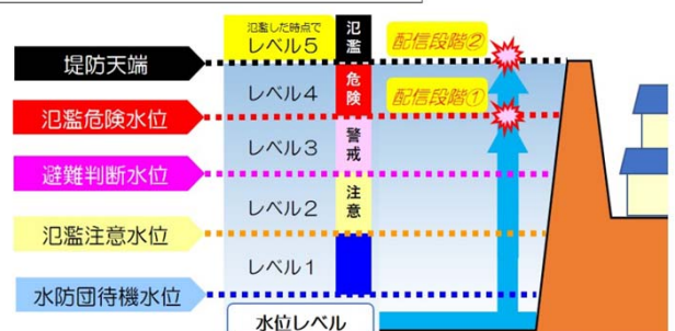
〇水位危険度レベルと配信タイミング イメージ