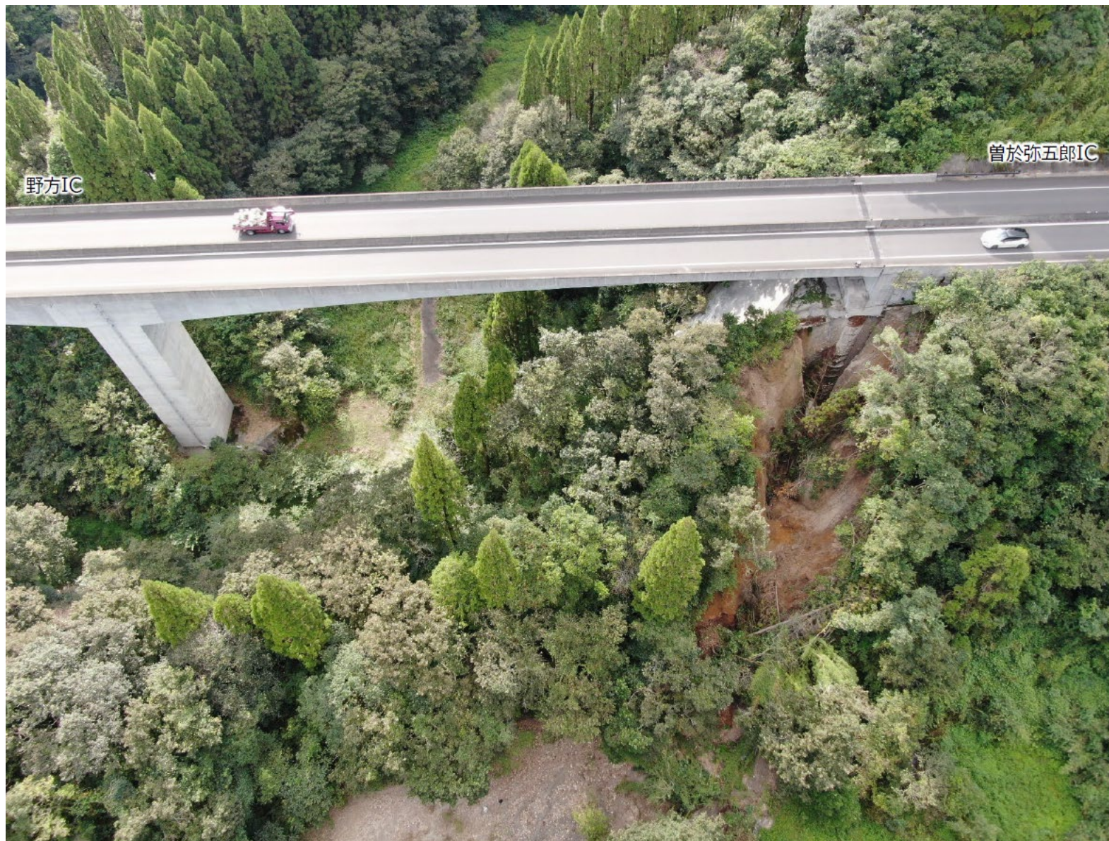
東九州自動車道 大鳥川橋 (おおとりがわはし) 曾於郡大崎町野方