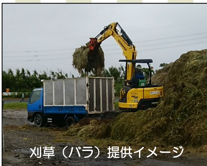
刈草（バラ）提供イメージ