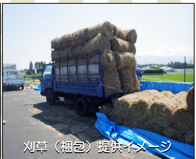
刈草（梱包）提供イメージ