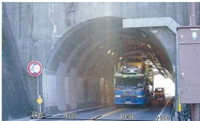
▲既設トンネルの大型車両はみ出し状況