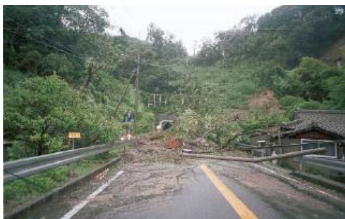
▲台風14号による海潟トンネル付近の災害状況(平成17年)