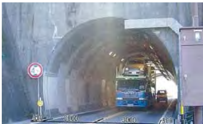
▲既設トンネルの大型車両はみ出し状況