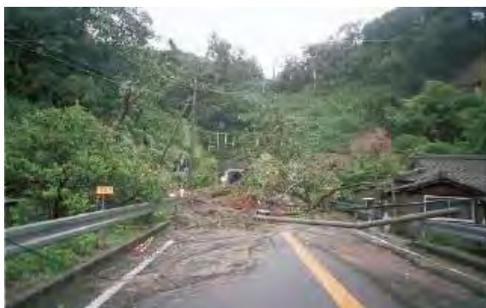
▲台風14号による海漣トンネル付近の災害状況(平成17年)