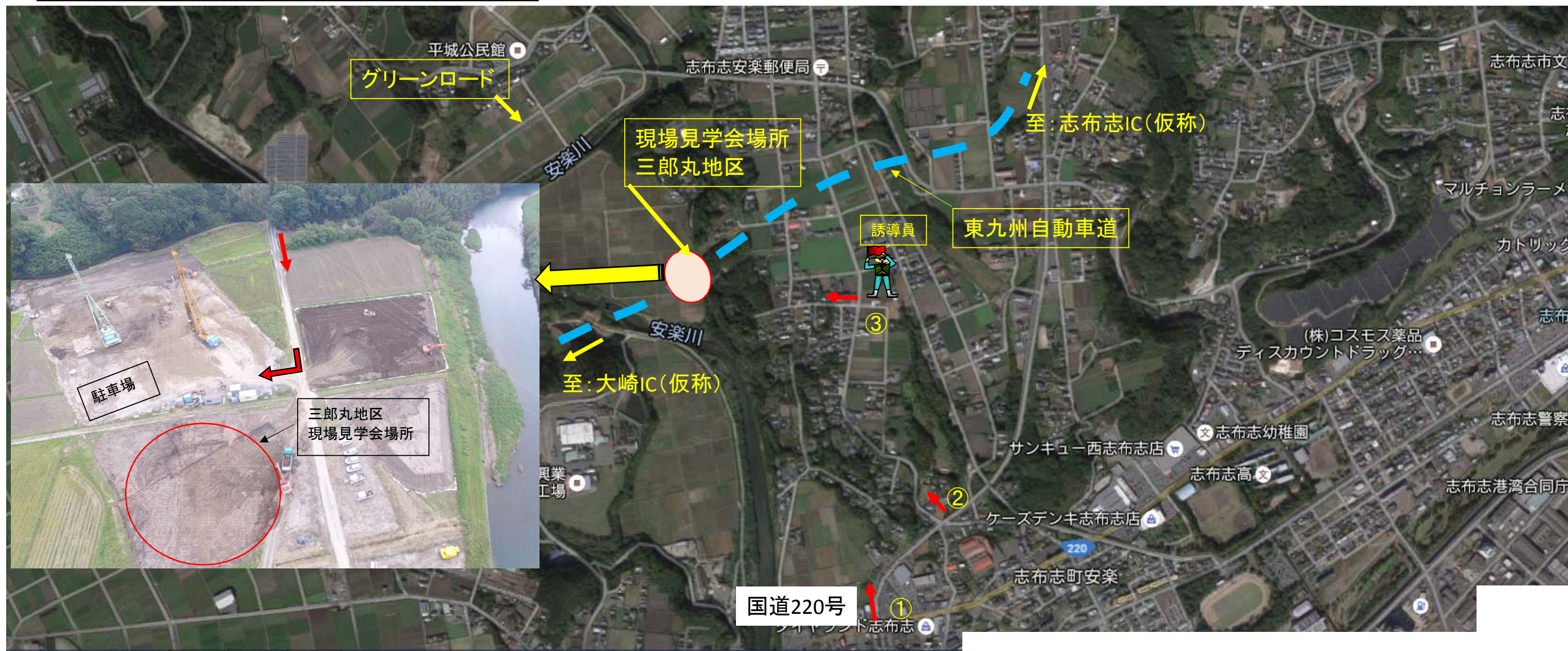
① 鹿屋方面より 国道220号志布志港入口交差点を左折