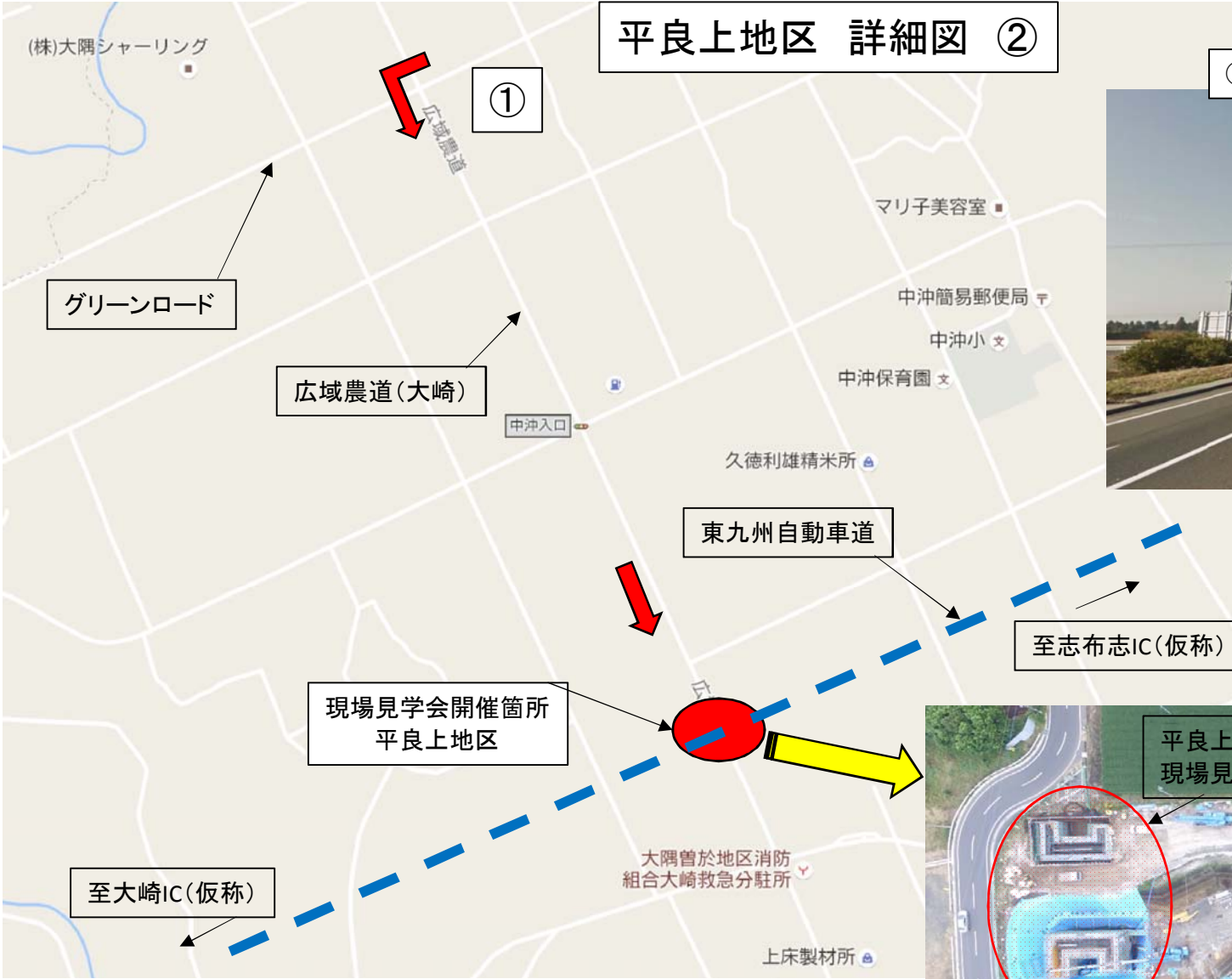
①グリーンロード広域農道交差点左折