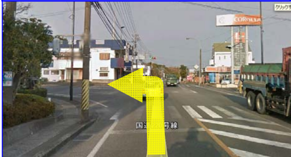
②市道飯山志陽線へ右折