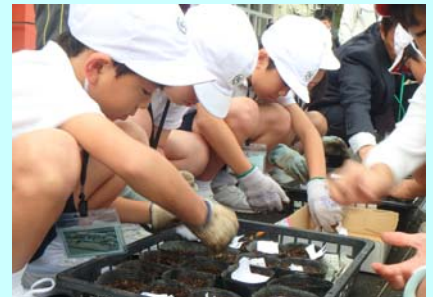
平成28年11月に行った点検隊任命式、歩道橋点検・清掃、花の種植え状況