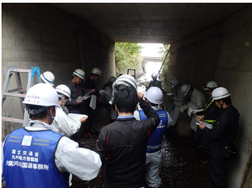
損傷状況の説明状況