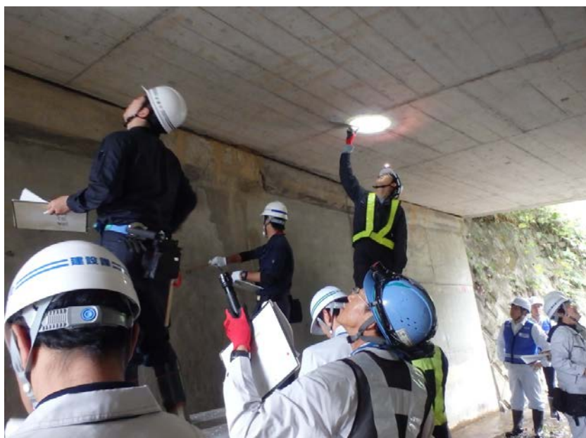
近接目視による点検状況