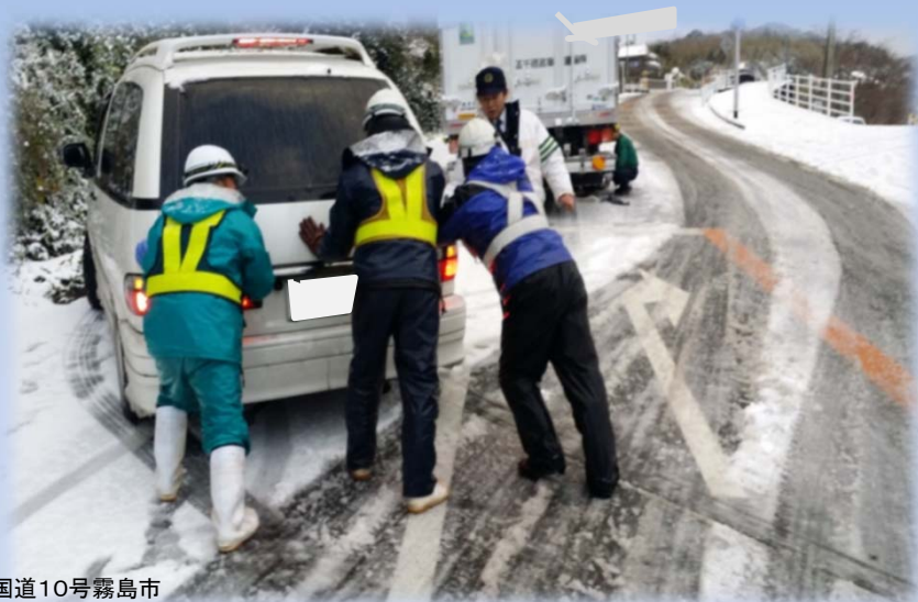
国道10号霧島市 亀割峠での雪対応