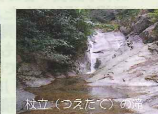
始良川上流の神野溪谷にある滝。写真の杖立の滝の他、周辺にはいくつもの滝が見られる。