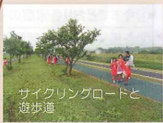
肝属川河口付近から吾平山上陵まではサイクリングロードが整備（始良川では右岸側）されている。始良橋から更生橋間には遊歩道がある。