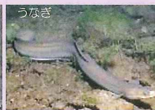
肝属川はウナギの稚魚が上る川として有名。川で数年生活したあと、太平洋の産卵場へ向かう。