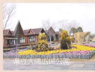
吾平山上陵の隣にある広大な敷地の公園。奥には食堂、遊具や宿泊可能なログハウスなどもある。みそうどんやしラーメンも名物。