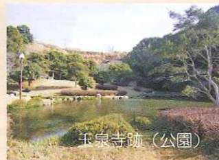
かつて玉泉寺があった跡は、公園になっており、四季折々の草木や花が楽しめる。