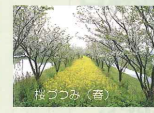
遊歩道沿いには季節によって異なった桜づつみの風景が楽しめる。