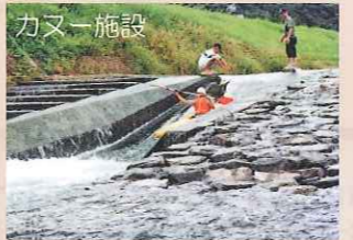
始良川の随所にはカヌーなどが利用しやすいようにスロープや発着場が設けられている。