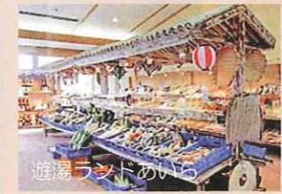
始良川沿いにある温泉施設。露天風呂など様々な温泉があり、館内には地元の食材も並び、宿泊も可能。