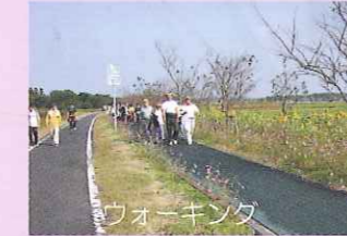
始良川沿いを歩いてみませんか？