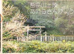
全国でも珍しい、洞穴を利用した御陵（天皇家の墓）。周辺は公園として整備されている。（宮内庁管理）