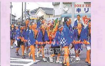
団体ごとに思い思いの衣装を身にまとった踊り子達と、色とりどりのみこしが登場しにぎわう。