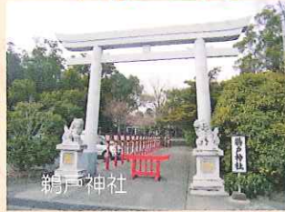
吾平町麓にある神社。この他にも始良川に沿って神社がある。

始良川沿いには、歴史的な文化財が随所にある。これらを探る始良川探索はいかがですか？