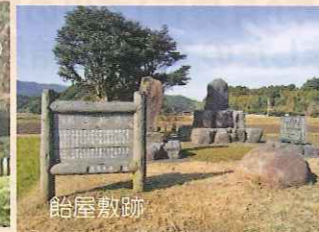
ここも神武天皇にゆかりのある文化財である。