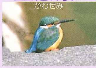
水中にダイビングして餌を取る。コバルトブルーの綺麗な模様が印象的である。縄張りを持つ。

始良川にはこの他にも多種多様な生物が生息する。探してみてください。きっと新たな発見がありますよ。