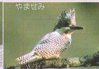
かわせみと同じような方法で餌を取る。頭の羽毛が冠のように逆立っているのが特徴である。縄張りを持つ。