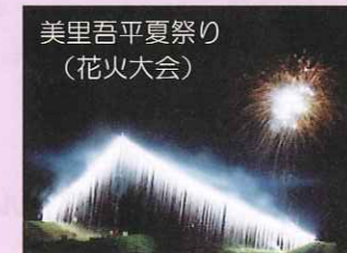
毎年8月に始良川の河川敷で開催される。水面に移る花火がとても幻想的である。