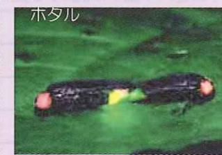
美しい光を放ちながら飛び交う様子は初夏の風物詩である。