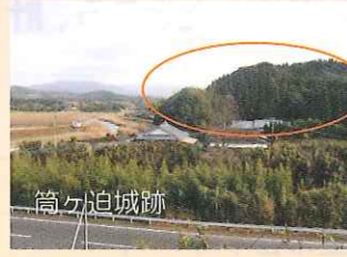
川を堀として利用するため始良川と苦野川の合流点につくられた城である。