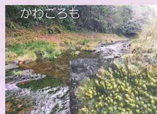
川底の岩上に生息する水生植物。早瀬を好み10月から12月頃に水中で花を咲かせる。（市指定天然記念物）