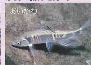
肝属川流域でも特に数が多い魚。産卵時期になると雄は、赤や青を帯びた美しい色になる。