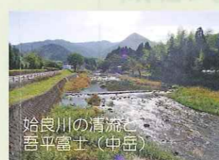
吾平自然公園の前では始良川の清流と神野地区のシンボル吾平富士（中岳）が望める。