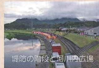
川に近づきやすくするための階段等も随所に整備されています。花火大会の会場にもなる。