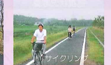
サイクリングも最近人気がある。