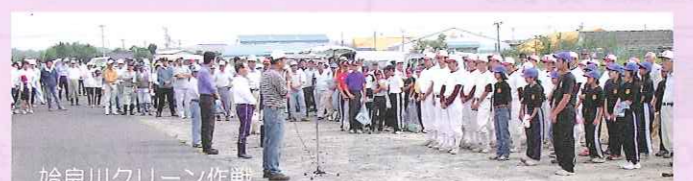
始良川河川愛護会が主体となり、毎年大勢の方々が参加する。皆さんの川への思いが伝わる。

「語りもんそ きもつっ川」は肝属川をより良くしていくためにはどうしたらよいかを語り合うため公募などにより集まった一般の方をメンバーとして設立されました。今回、地域住民の方に肝属川水系の一つである始良川のすばらしさを伝える「よかとこマップ」を作成しました。マップは下記の箇所に設置しています。