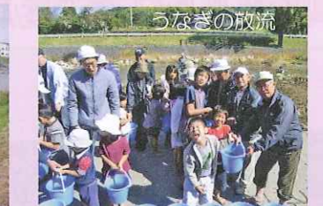
始良川河川愛護会と小学生によるうなぎの放流の様子。子供の頃の自然とのふれあいはとても大切ですね。