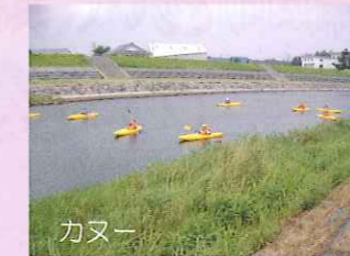
始良川でのカヌー大会も行われる。