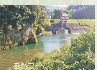
深みは水の色が青い。起伏に富んだ地形が生物の絶好のすみかになる。