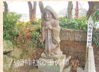
田畑を守る田の神。一つ一つ表情や格好が異なる。