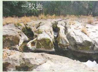
始良川支川である苦野川の一枚岩を流れる河道は自然が創り上げた芸術品である。

始良川にある自然を楽しむ多くのスポットがある。四季折々の風景と自然が創り上げた絶景を楽しめる。