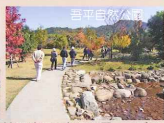
神野地区にある公園。四季折々の風景が楽しめる。園内には水をテーマにした施設「ウォーターパール館」もある。