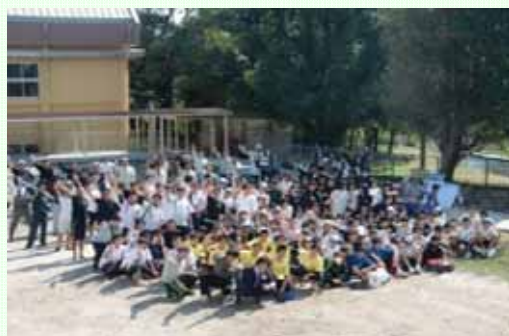
・大隅河川国道事務所の職員も参加しました。

除去した区間の水草は、外来種で繁殖力が強く異常繁殖していました。このため、ゴミやヘドロ等が引っかかり水質の悪化や悪臭の元になると考えられます。また、川の流れも悪くなっていました。