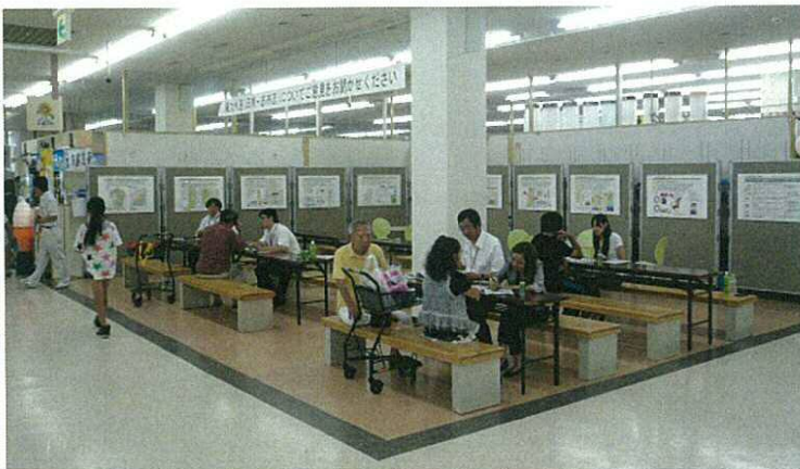
前回の会場の様子(サンポートしぶしピア) 平成 25 年 7 月 26 日