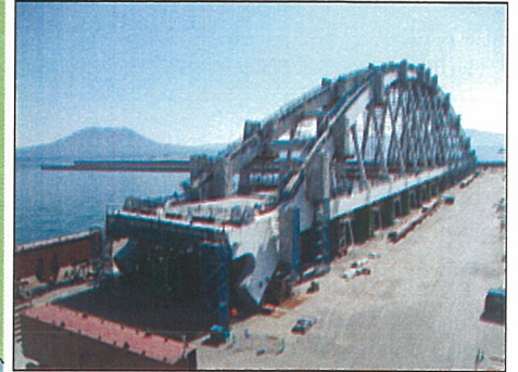
[牛根大橋(仮称)上部工地組状況]