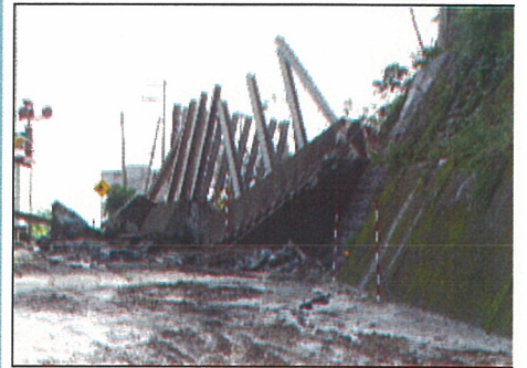
[平成17年9月台風14号災害発生状況]

※牛根大橋(仮称)橋長: L=381m、中央径間L=260mのバランスドアーチ橋 ※牛根高架橋(仮称)橋長: L=477m