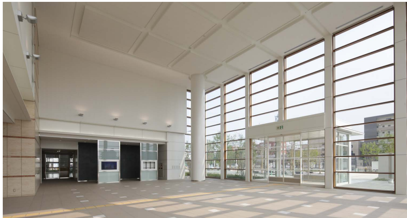
A棟エントランスホール

敷地外周にはフェンスを設けずに気軽に立ち寄りやすいつくりとしており、1階の玄関は市電の電車側と駐車場側の二箇所にて設けました。