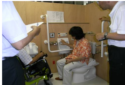
モックアップによる検証