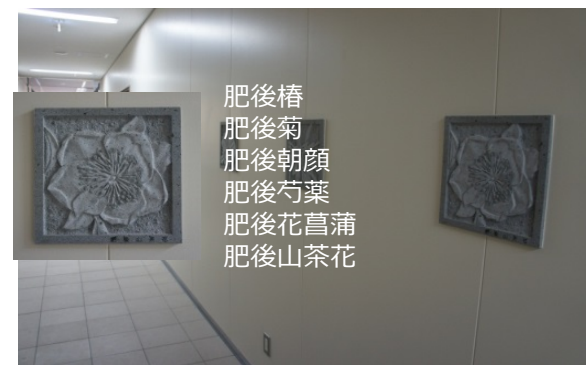
肥後椿 肥後菊 肥後朝顔 肥後芍薬 肥後花菖蒲 肥後山茶花