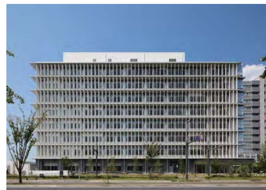
「熊本城の長塀」をイメージした外観 (B棟)

B棟は外観を熊本城の長塀をイメージし、エントランスホールの吹き抜け部分の内壁は、「鎧張り」と「狭間」(さま)をイメージしたデザインとしています。