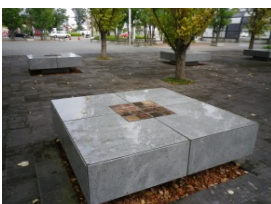
レンガを埋め込んだベンチの座面