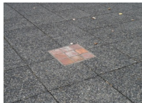
交流広場のレンガ舗装