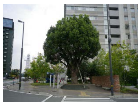
整備前の熊本駅前にあったクスノキ