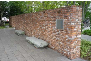
レンガの壁と石のベンチ

この地は、明治以来ながく工場地として熊本の近代化を見つめてきた場所であることから、工場の建物に使われていたレンガを再利用しています。