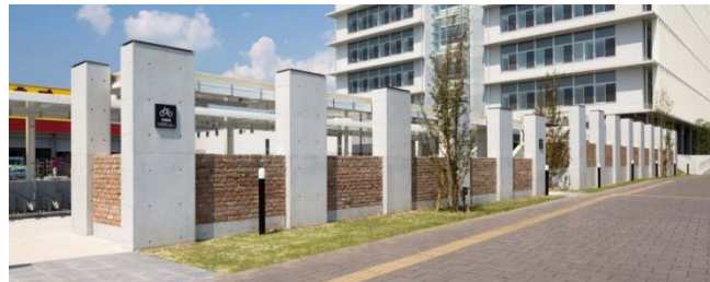
レンガを再利用した駐輪場の壁