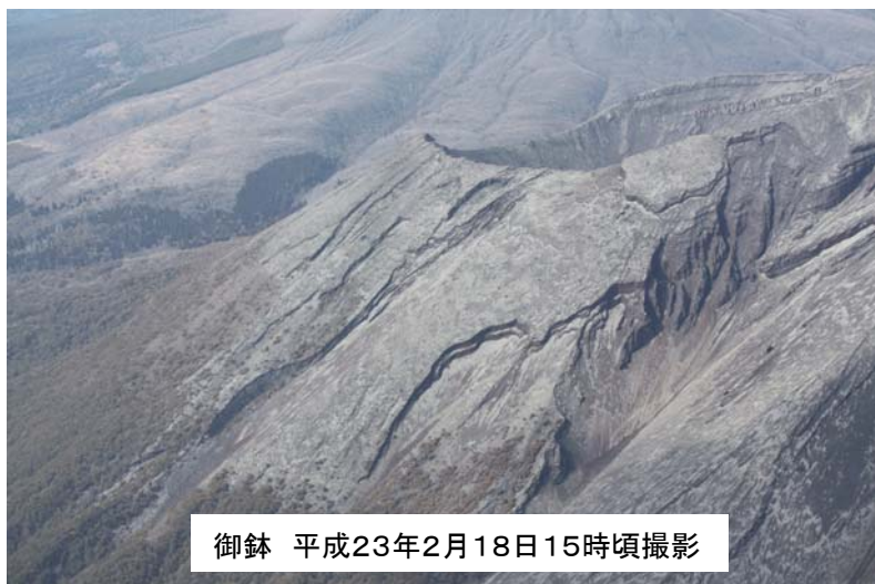
御鉢 平成23年2月18日15時頃撮影