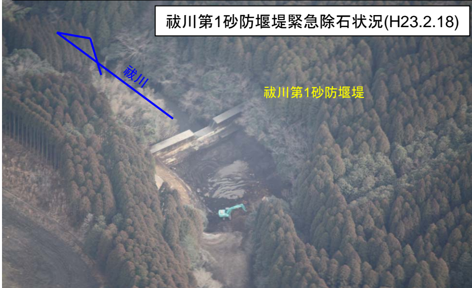
祓川第1砂防堰堤緊急除石状況(H23.2.18)