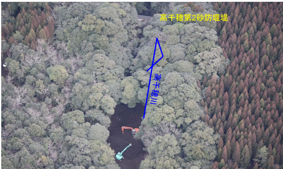
高千穂第2砂防堰堤緊急除石状況(H23.2.18)