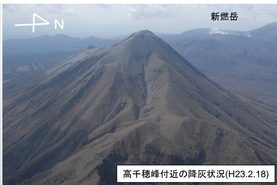
高千穂峰付近の降灰状況(H23.2.18)