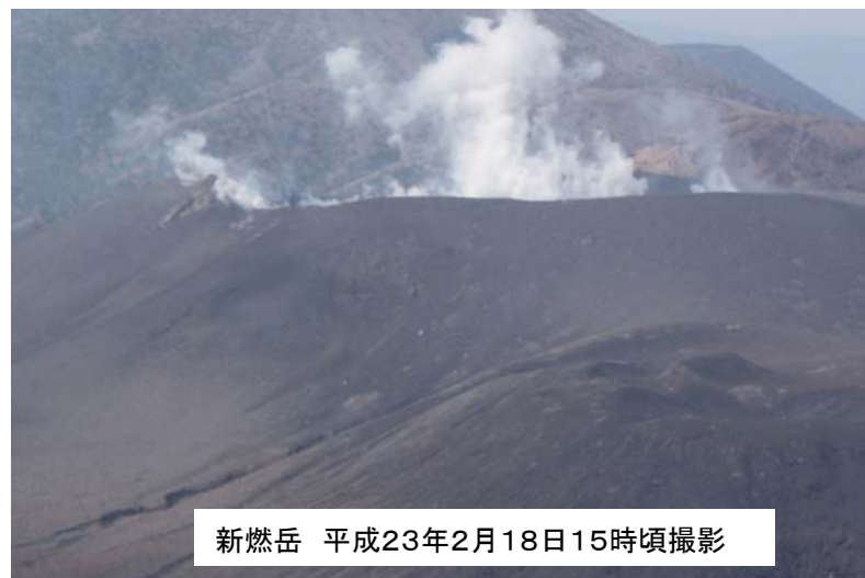
新燃岳 平成23年2月18日15時頃撮影