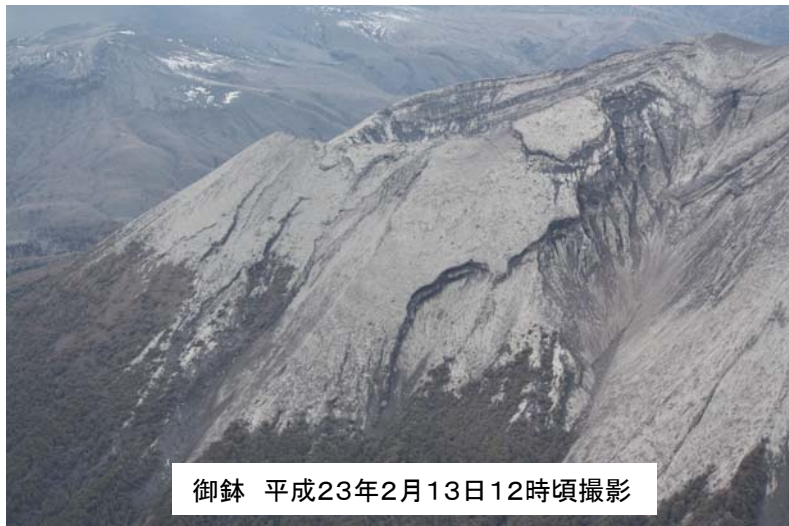
御鉢 平成23年2月13日12時頃撮影

平成23年2月16日から17日の降雨後の18日に御鉢、新燃岳周辺、溪流をヘリ調査しました。 前回調査の2月13日状況と比較し、山腹や溪流に変状は確認されませんでした。