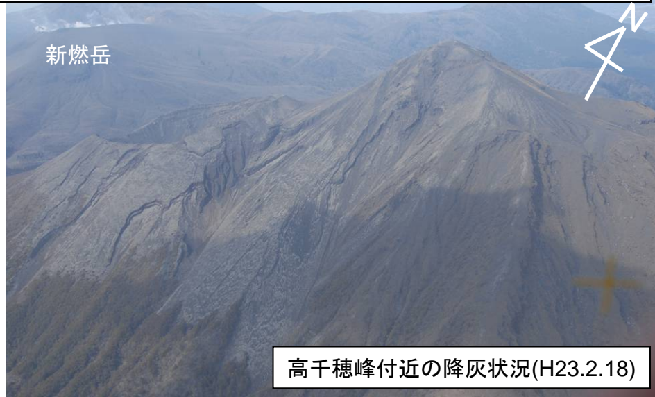
高千穂峰付近の降灰状況(H23.2.18)