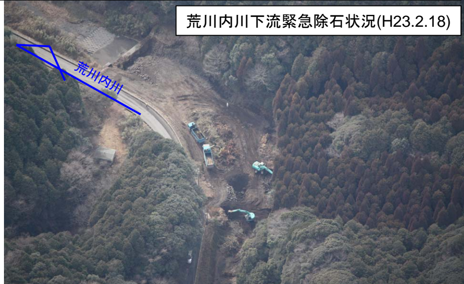
荒川内川下流緊急除石状況(H23.2.18)