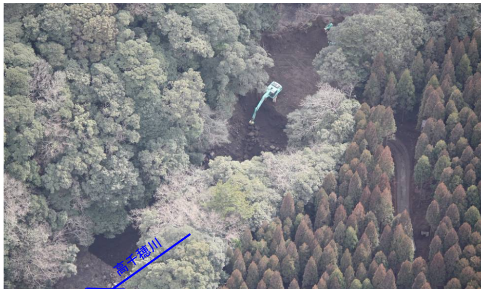
高千穂第3砂防堰堤緊急除石状況(H23.2.18)