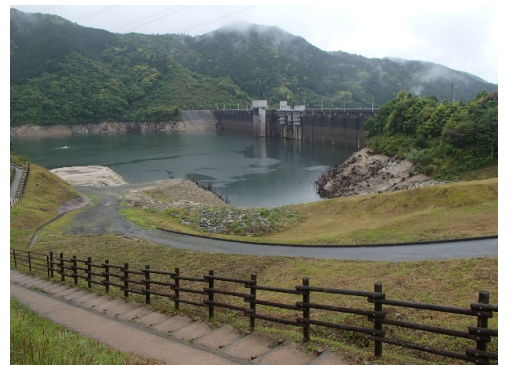
令和4年5月13日 13時現在 貯水率 58.7%