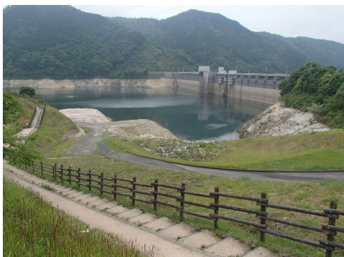
令和4年5月26日 13時現在 貯水率 53.3%