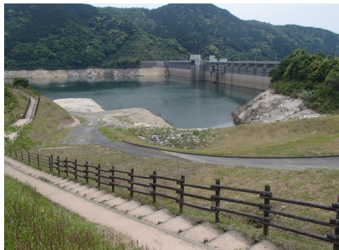
令和4年5月19日 13時現在 貯水率 56.9%