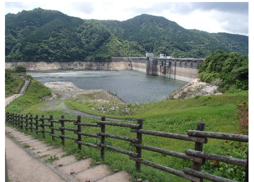
令和4年6月23日 10時現在 貯水率 39.8%