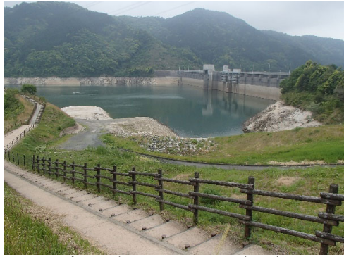
令和4年5月6日 13時現在 貯水率 59.5%