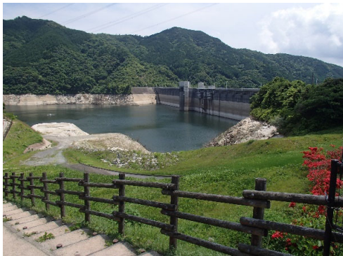
令和4年6月16日 13時現在 貯水率 43.2%