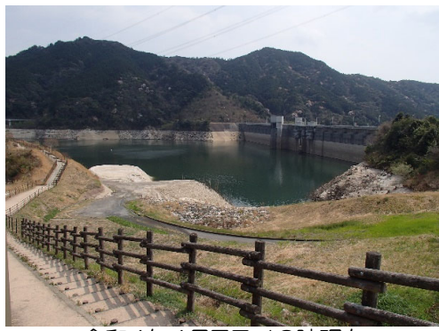
令和4年4月7日 13時現在 貯水率 55.2%