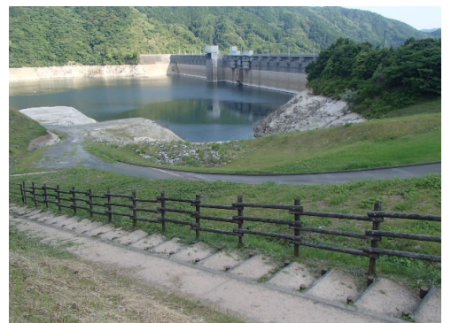
令和4年6月2日 17時現在 貯水率 50.3%