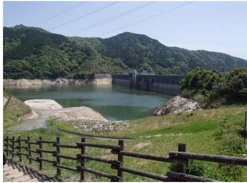
令和4年4月28日 13時現在 貯水率 55.1%