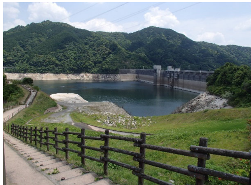
令和4年6月9日 13時現在 貯水率 47.8%