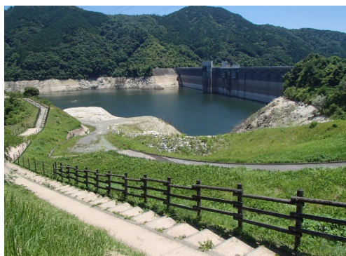
令和4年6月30日 13時現在 貯水率 37.7%