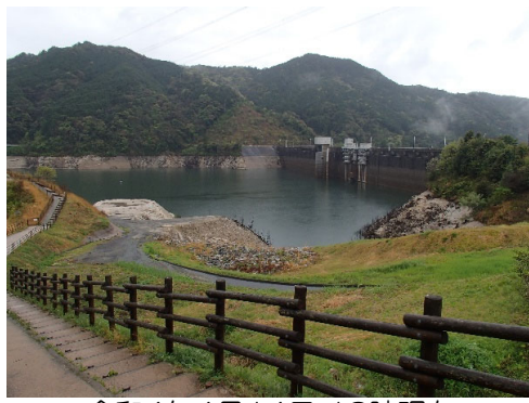
令和4年4月14日 13時現在 貯水率 53.5%