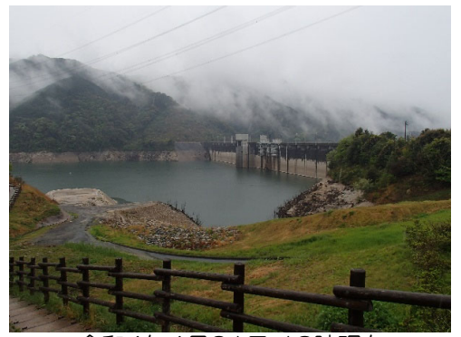
令和4年4月21日 13時現在 貯水率 54.1%