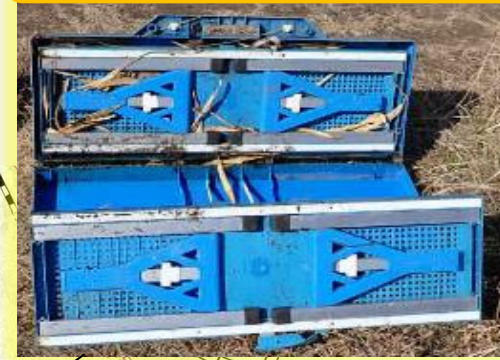
令和4年2月21日発見 番匠川左岸 樗野橋下流（折り畳みテーブル）