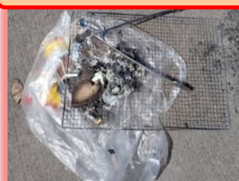
令和3年5月6日発見 番匠川右岸 森下橋上流（BBQ関係）