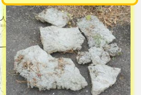
令和4年2月14日発見 番匠川左岸 長瀬橋下流（コンクリート殻）