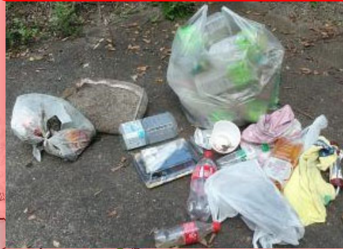
令和3年8月31日発見 井崎川左岸 染矢橋上流（家庭ゴミ）