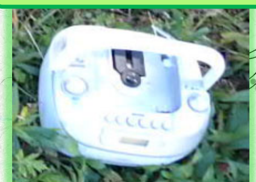
令和3年12月22日発見 番匠川左岸 脇樋門下流（CDラジカセ）