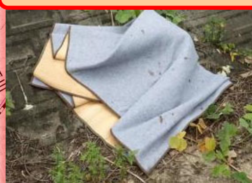
令和3年9月27日発見 番匠川左岸 白尾橋上流（カーペット）