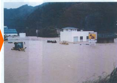
小田地区内水被害状況 (平成16年9月台風14号)