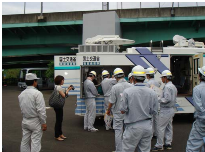
↑ 衛星通信車の発電機を点検