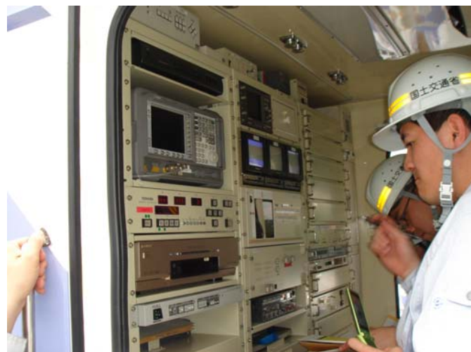
↑ 衛星通信車の操作手順を確認