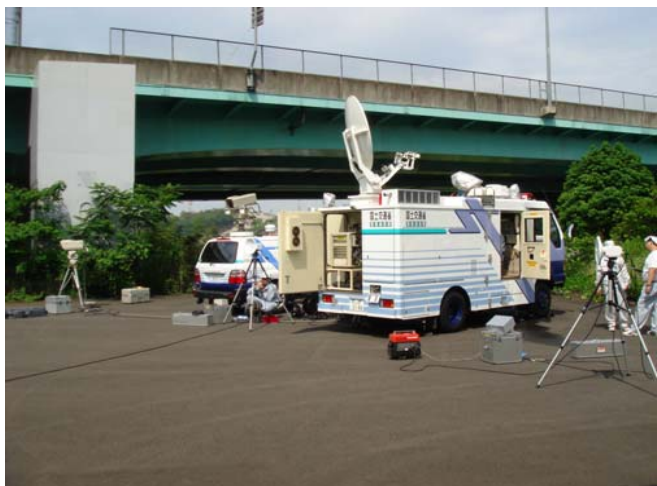
↑ 衛星通信車の設営訓練の様子