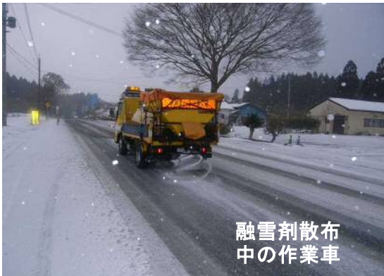
融雪剤散布中の作業車

また、除雪作業や融雪剤散布中の低速作業車が走行するため、皆様にはご迷惑をお掛けしますが、ご理解・ご協力をお願いします。