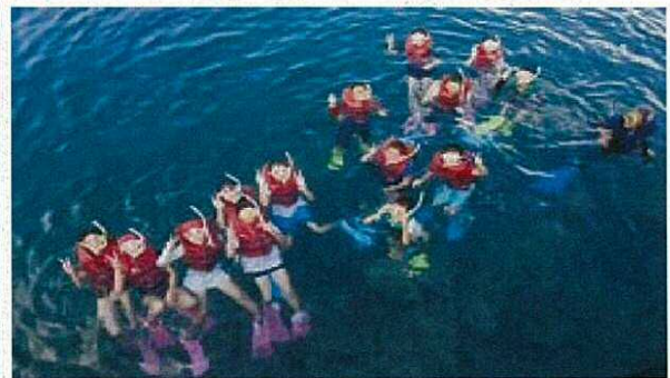
〈シュノーケリング体験〉