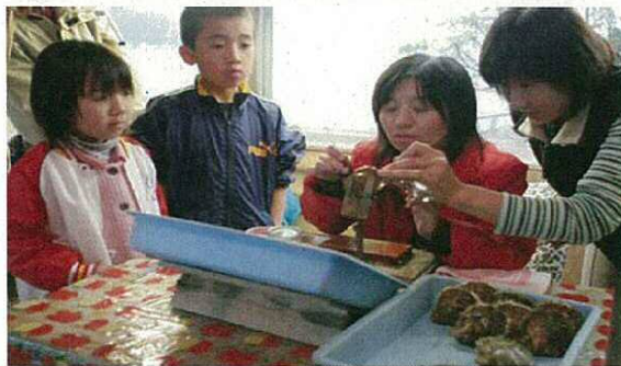
〈真珠アクセサリー作り体験〉