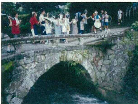
〈石橋上での郷土史の勉強風景〉