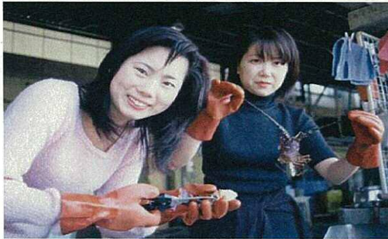
〈伊勢えびの捌き方教室〉